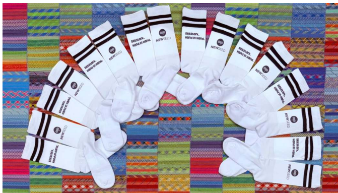
Bild oben: Die neuen „Teamsocken“ von NewSeed - Dankeschön für die geleistete Arbeit

Seit nunmehr fast 7 Jahren produzieren wir für dieses Unternehmen eine Vielzahl verschiedenster Produkte aus Kletterseilen. Diese Produkte bilden die Grundsubstanz für den Bereich Näherei. Es sind attraktive Arbeitsplätze entstanden, nicht nur für Mitarbeiter die nähen können. Es gibt verschiedenste Tätigkeiten, die auch von Mitarbeitern ausgeführt