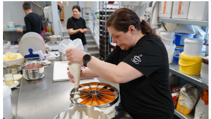
Bilder diese Seite: In der Eiswerkstatt | Beim Bildungskurs „Politik und Gesellschaft“ in Peitz

gleichzeitig eine angenehme Arbeitsatmosphäre für unsere Mitarbeiter zu schaffen, wurde ein zusätzlicher Raum umgestaltet. Dort sind fünf weitere Arbeitsplätze entstanden.