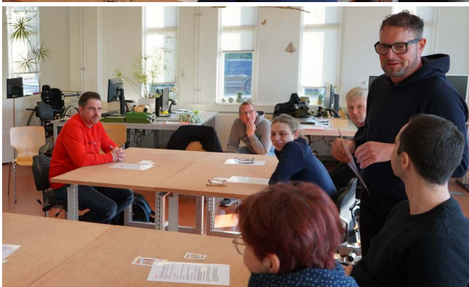
Bilder oben: Beschäftigte der LW erproben im Rahmen einer Weiterbildung die Methode der Simulation Bilder unten: Beim Bildungstag „Großküchentechnik“ im Catering der Werkstatt Cottbus Nord