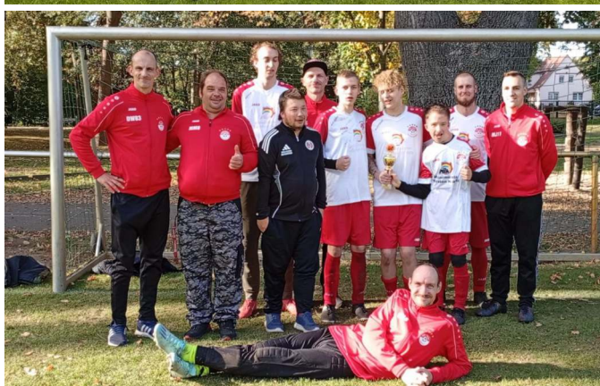
Bilder oben: Die Mannschaft des BSV war Tagessieger beim Abschlussturnier 24/25 | Das BSV-Siegerteam beim Landesligaeröffnungsturnier 25/26 in Kolkwitz

Ein wesentlicher Erfolgsfaktor ist das engagierte Team hinter den Kulissen. Trainer sowie zahlreiche Helferinnen und Helfer leisten wertvolle Arbeit und tragen maßgeblich dazu bei, dass der Vereinsbetrieb reibungslos funktioniert. Ihr Einsatz verdient besondere Anerkennung.