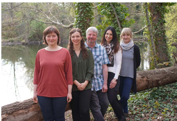
Bild unten: Das Team des Förder- und Beschäftigungsbereiches am Ostrower Damm