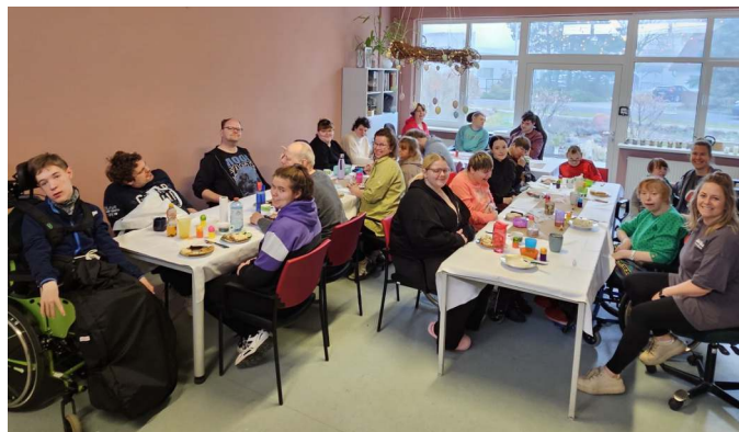
Bild oben: Gruppenfoto der Teilnehmer der Schreibwerkstatt in Dahmshöhe am See